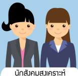
นักสังคมสงเคราะห์ หรือ นักจิตวิทยา