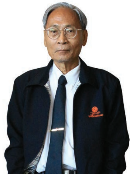
คุณสรรพลสิทธิ์ คุมพ์ประพันธ์ อดีตรองกรรมการสิทธิเด็กแห่งสหประชาชาติ

มาตรการทางสังคม คือ การปลูกจิตสำนึกในเรื่อง การคุ้มครองเด็ก เรื่องความปลอดภัยของเด็ก การปลูกจิตสำนึกต้องใช้มาตรการทางการศึกษา เอาบทเรียนของประเทศต่าง ๆ เอาปัญหาที่เกิดขึ้น แนวทางแก้ปัญหา คนที่เกี่ยวข้องควรทำอะไร ไม่ใช่การใส่ไว้ในหลักสูตรของโรงเรียน ไม่ว่าจะประเด็นใด ตัวอย่างเช่น เรื่องเพศ (Sex Education) ซึ่งมี 2 ส่วน คือ Sexuality มีเนื้อหากว้างขวาง แต่ส่วนใหญ่สอนแค่เรื่องการมีเพศสัมพันธ์กับการป้องกัน ซึ่งไม่ใช่เรื่องที่ต้องทำในอันดับแรก สิ่งที่ต้องทำอันดับแรก คือ เด็กต้องมีความสามารถในการดูแลตนเองเรื่องเพศ พัฒนาตามสมควรจะเป็นในแง่ไม่ให้ตนเอง อยู่ในสถานการณ์ที่ถูกกระตุ้นรั้าอารมณ์เพศ ต้องเรียนรู้เรื่องพวกนี้ แต่ไม่มีใครสอน Gender บทบาทหญิงชาย และความเสมอภาคทางเพศ การกำหนดความสัมพันธ์ทางสังคมกับเพศตรงข้ามอย่างเหมาะสม