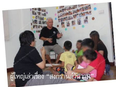
ผู้ใหญ่เล่าเรื่อง “สงกรานต์วันวิสาข”