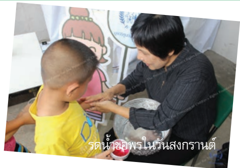
รหน้าขอพรในวันสงกรานต์