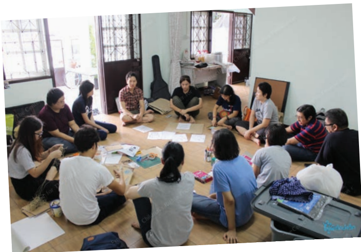
ก่อนเริ่มกิจกรรมทุกครั้ง อาสาสมัครจะประชุมเตรียมงานและอุปกรณ์

และด้วยเหตุผลนี้จึงทำให้เกิดการรวมตัวกันขึ้นของเหล่าอาสาสมัครผู้พิทักษ์เด็ก พื้นที่จรัญสนิทวงศ์ 12 การทำงานของอาสาสมัครเริ่มจากการสำรวจชุมชน สอบถามความต้องการของเด็กๆและการใช้เวลาว่างของเด็กๆ เพื่อออกแบบเป็นกิจกรรมที่สร้างเสริมพัฒนาการและทักษะชีวิต ทักษะสังคม ฯลฯ ให้สอดคล้องกับเด็กแต่ละช่วงวัย หลังจากนั้นมีการอบรมเตรียมความพร้อมอาสาสมัคร