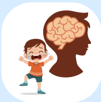
เจ็บป่วยทางจิต วิตกกังวล ซึมเศร้า นับถือตนเองต่ำ ทำร้ายตนเอง พยายามฆ่าตัวตาย

การลงโทษทางร่างกายและอันตรายที่เกี่ยวข้องสามารถป้องกันได้ผ่านแนวทางหลายแง่มุม เช่น