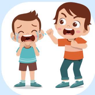
มีพฤติกรรมรุนแรง ก่ออาชญากรรม