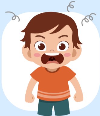
เพิ่มความก้าวร้าวในเด็ก