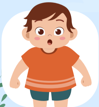
มีปัญหาเกี่ยวกับสุขภาพ ต่อเนื่องไปจนโตเป็นผู้ใหญ่ เช่น ไมเกรน หัวใจ มะเร็ง โรคอ้วน