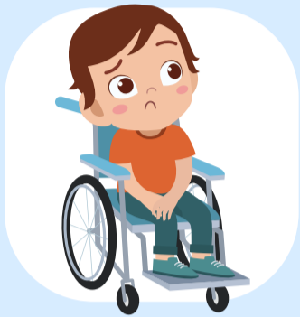
พิการหรือเสียชีวิต

งานวิจัยจำนวนมากชี้ว่า การลงโทษเกิดผลลัพธ์เชิงลบต่อเด็ก ทั้งในระยะสั้นและระยะยาว