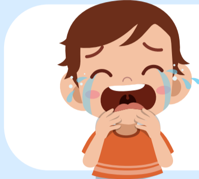
ทำลายความสัมพันธ์ของเด็กกับผู้ดูแล