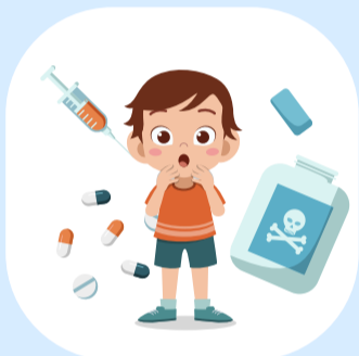
ติดแอลกอฮอล์ และยาเสพติด