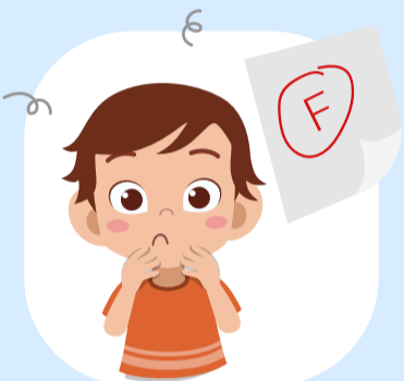
มีความล้มเหลวด้าน การเรียนรู้และอาชีพ