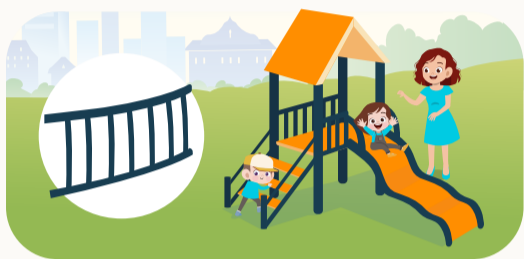
installing safety devices

Schools must assess potential dangers in the surroundings, such as buildings, equipment, sports facilities, and hazardous materials. The environment should be adjusted to ensure safety, with regular inspections, repairs, and improvements.