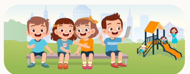
ensuring proper ventilation in rest areas

Failure to address these risks could result in serious or life-threatening accidents.