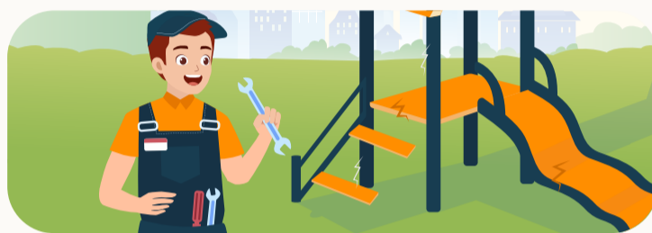
fixing broken items & providing safe toys