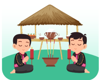
ได้นับถือ ศาสนาตามความเชื่อ