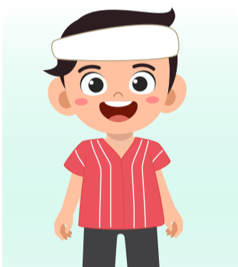
เด็กชนพื้นเมือง

เช่น เด็กที่ใช้ภาษาต่างจาก ภาษาหลักของประเทศ