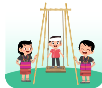
ได้แสดงออก ทางประเพณี และวัฒนธรรมของตนเอง