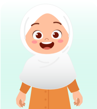
เด็กที่มีศาสนา