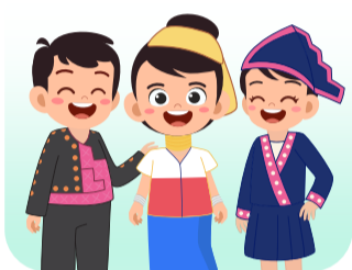
ได้รับ เอกลักษณ์วัฒนธรรม