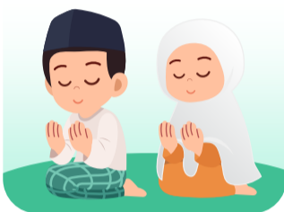
ได้มีเสรีภาพ ในการร่วมกิจกรรมชุมชน