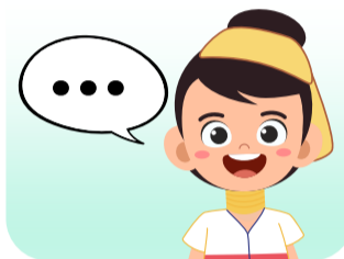
ได้ใช้ภาษาของตน ในการสื่อสารและเรียนรู้