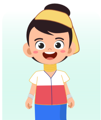
เด็กชนกลุ่มน้อย

เช่น เด็กที่ใช้ภาษาต่างจาก ภาษาหลักของประเทศ